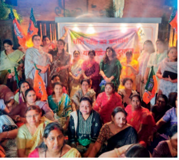
भाजपा राष्ट्रीय उपाध्यक्ष सरोज पाण्डेय के नेतृत्व में हुआ धरना प्रदर्शन